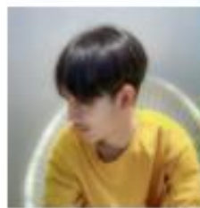
ช่างวัน ชัยชาน ช่างวัน ชัยชาน เป็นช่างตัดผมช่างเบอร์ที่ ๑๑๑ ช่างเบอร์ 999